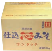
⑦2 ワンタッチ仕込みそ

※2~4名のご家庭で1~2年分の消費量です ※製造日から5年以内を目安にお召し上がりください。