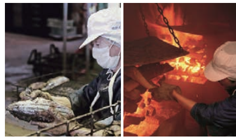
▲一尾つつ丁寧に骨抜きを行います。 ▲薪で燻す焙乾(ばいかん)作業。