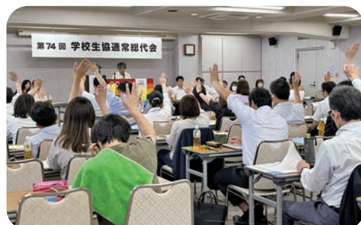
▲全議案 賛成多数で可決