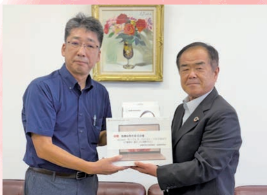
石川県学生協に全国の学生協、教育関係団体から1,234万円の支援金が集まり、学校現場で活用されています。 (写真は、珠洲市教委、市内小中学校にパソコンが届いた時の様子)