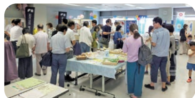
▲8/2「学生協まつり」、ご来場ありがとうございました。