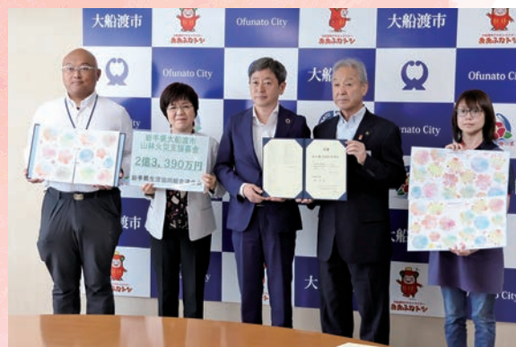
岩手県生活協同組合連合会に全国の生協・団体・個人から2億3,390万円の支援金が集まり、大船渡市長に贈呈されました。